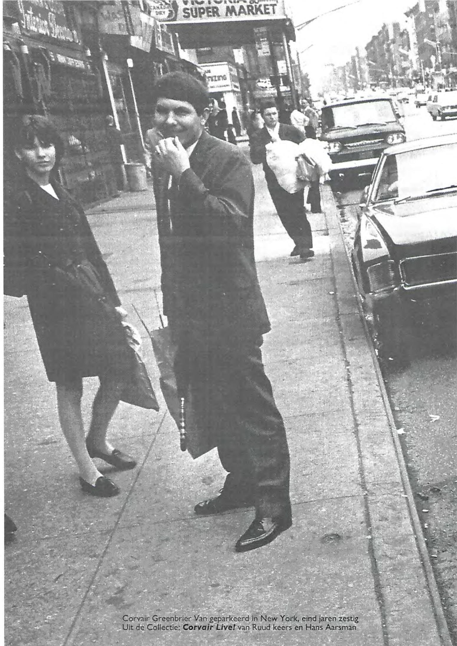
Corvaair Greenbrier Van geparkeerd in New York, eind jaren zestig