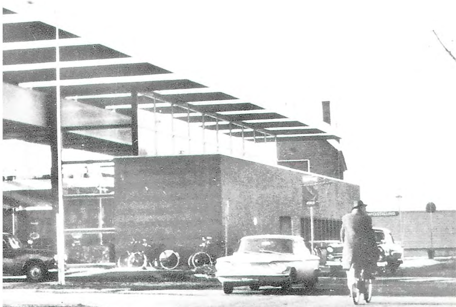
Een Early parkeert op NS-station Almelo, eind jaren zestig