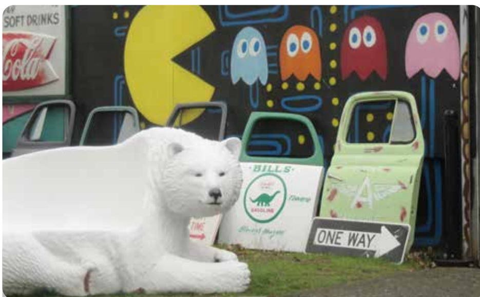
Rosalie: Super leuke ijsberen bank en Pac-Man zoals papa's sokken