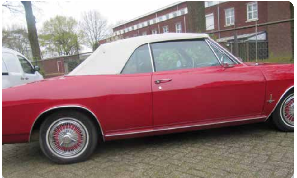
Rosalie: deze ook, want ik vind rood op auto's mooi