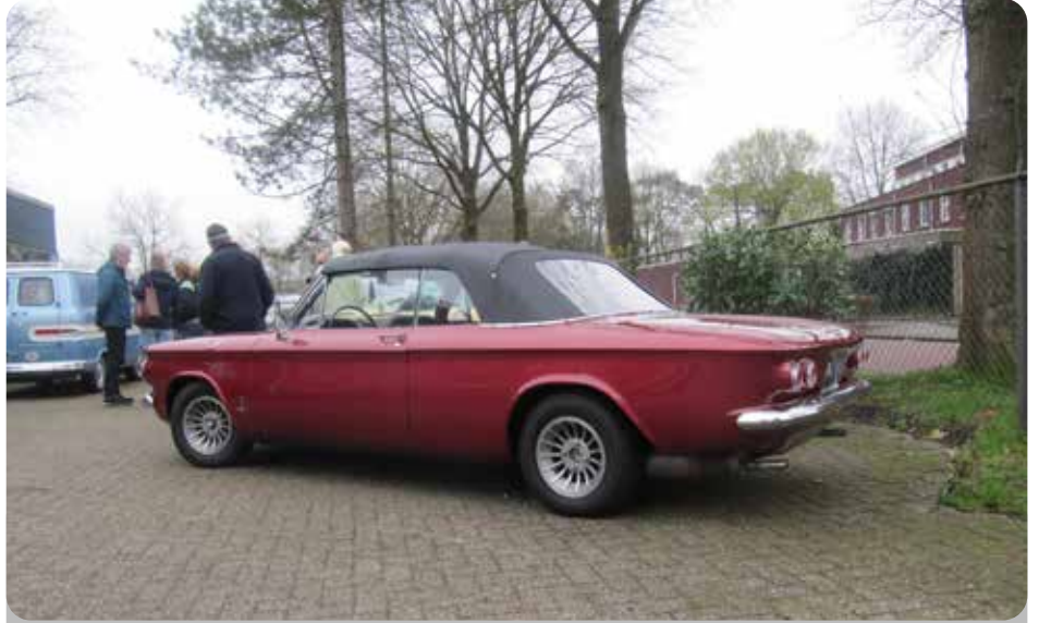
Rosalie: Deze auto heeft een mooie rode kleur