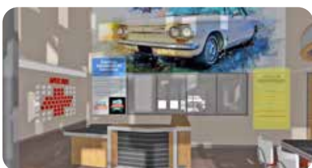
Entree en sponsor/donatiemuur