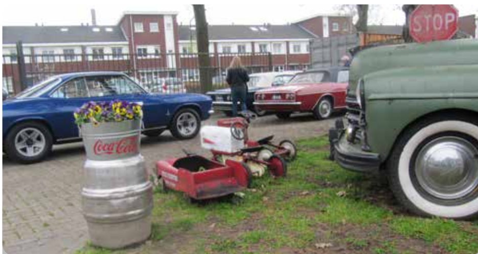
Rosalie: De kleine autootjes tussen de grote auto's

een groot pand dat nokkie vol staat met jukeboxen en aanverwante artikelen. Zo zijn er ook Elvis, Kerst hoeken en veel meer ingericht met mooie items om te zien en te kopen. Je komt er ogen te kort zeker voor een groot liefhebber als ik. Dit zijn panden waar men mij zou kunnen opsluiten maar vergeet me niet af en toe een kop cappuccino te geven. De leden vermaakten zich kostelijk met rond kijken en ook gezellig bij elkaar zitten kletsen. Buiten rondom de Corvairs was het een gezellig samen zijn en gepraat er over. Verassing voor mij was de aanwezigheid van mijn 2de Corvair uit Las Vegas. Ik had hem niet eens herkend. Weer even leuk met de eigenaar kunnen kletsen.