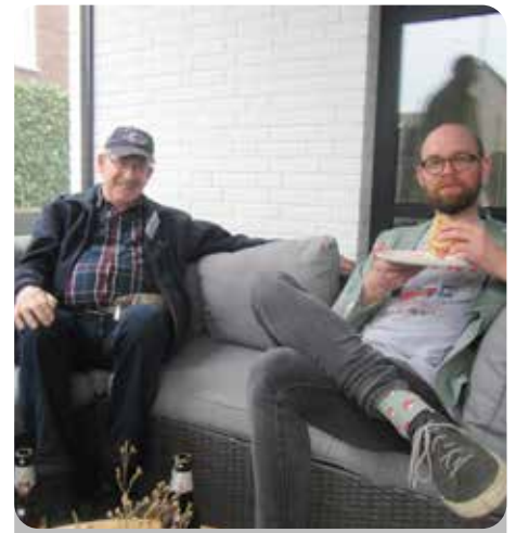
R. : Mooie foto van jullie