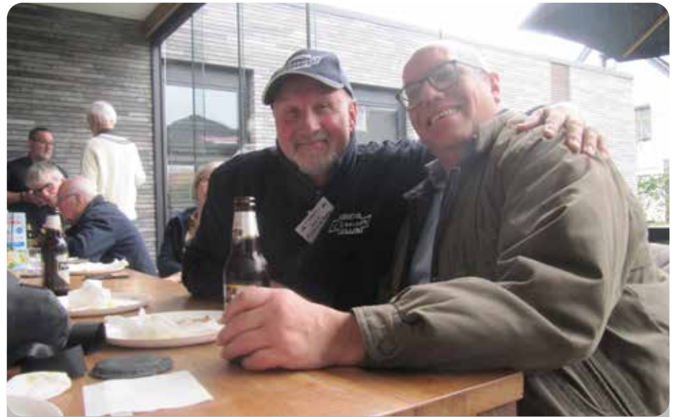
Rosalie: Super leuk om ook een foto van jullie 2 te mogen maken