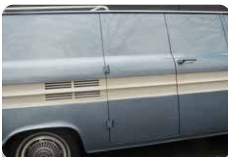
R. : Er was een bus zonder ramen