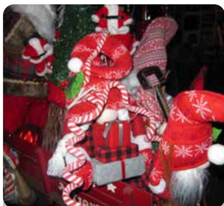
R. : Zuurstokken!