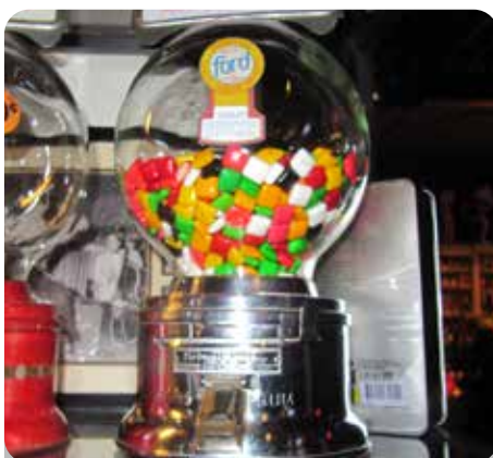
R. : Allemaal gekleurde snoepjes