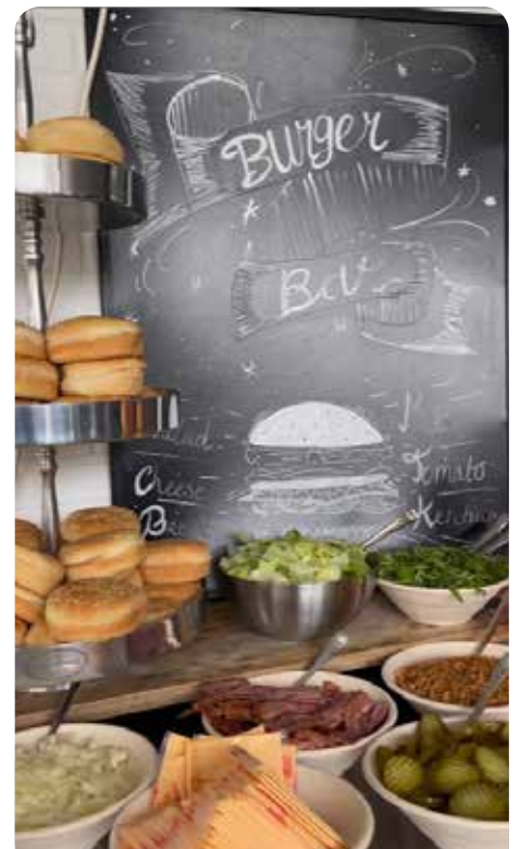
Burger buffet en "het beruchte bord"