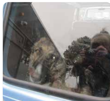
R. : Kijk er zat een hond in de bus