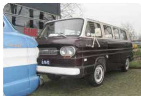
R. : En er was een bus met ramen