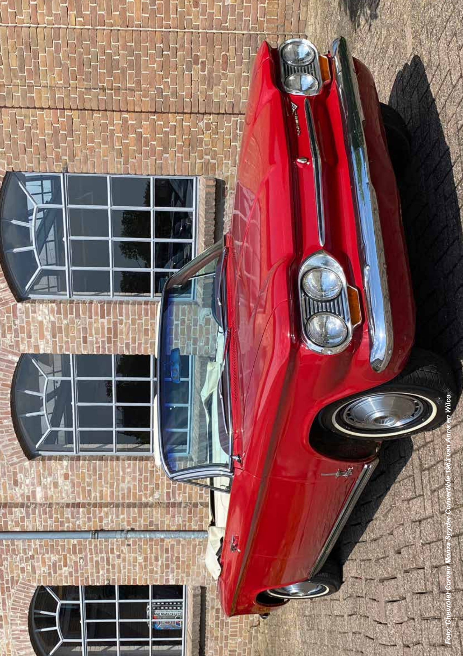
Foto: Chevrolet Corvair Monza Spyder Convertible 1963 van Anna en Wilco