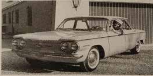
CHEVROLET CORVAIR 1960-1964

(Sorry voor de slechtere foto's, snel genomen en met de telefoon)