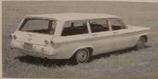
CHEVROLET CORVAIR MONZA WAGON 1962