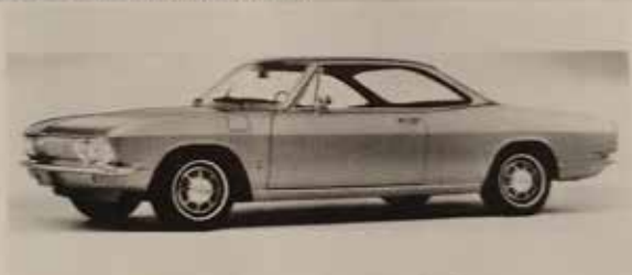
CHEVROLET CORVAIR MONZA 1968