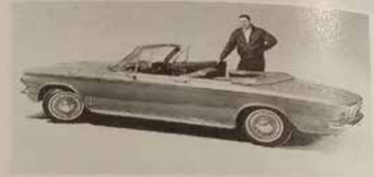
CHEVROLET CORVAIR MONZA SPIDER 1964