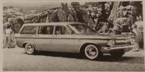
CHEVROLET CORVAIR LAKEWOOD WAGON 1961