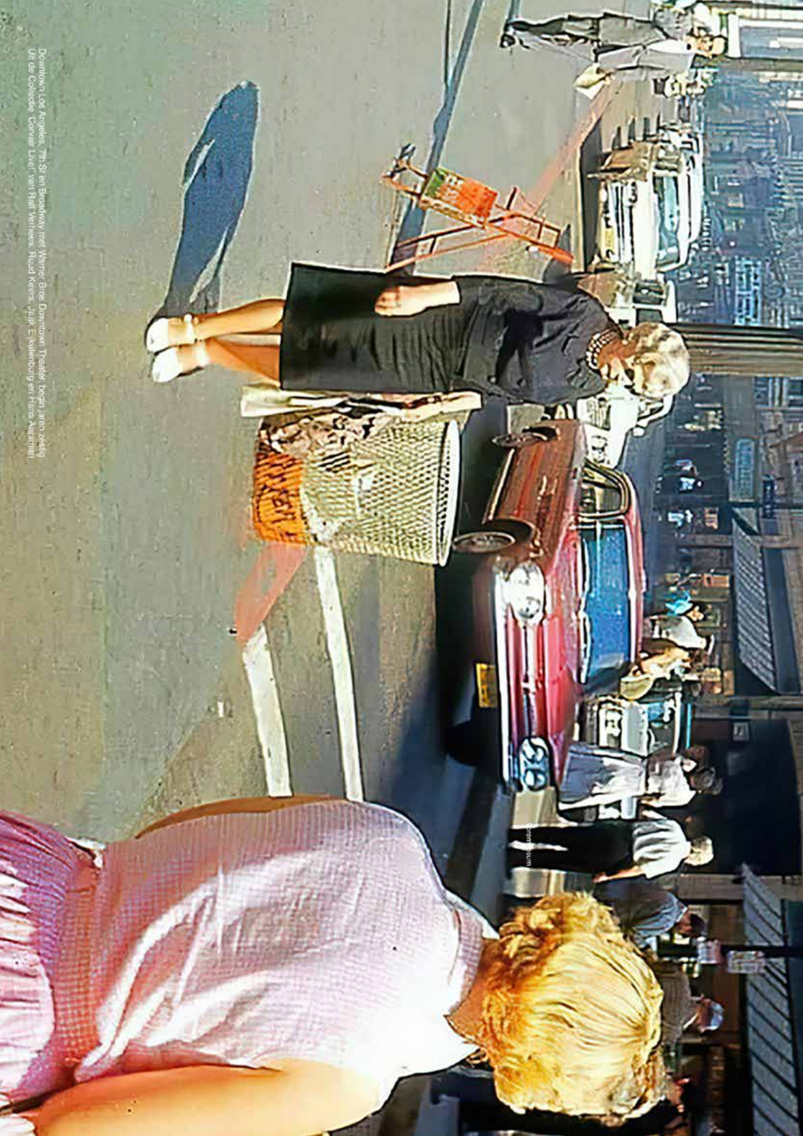
Downtown Los Angeles, 7th St en Broadway met Warner Bros. Downtown Theatre, begin jaren zeventig.