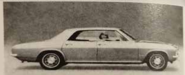
CHEVROLET CORVAIR MONZA SPORT SEDAN 1967