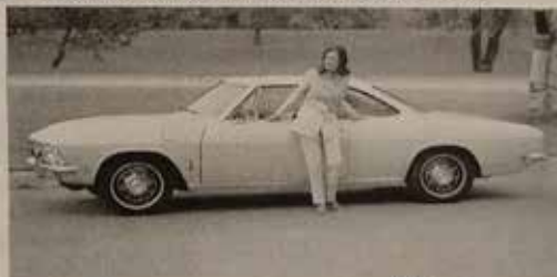
CHEVROLET CORVAIR MONZA HARDTOP COUPE 1969