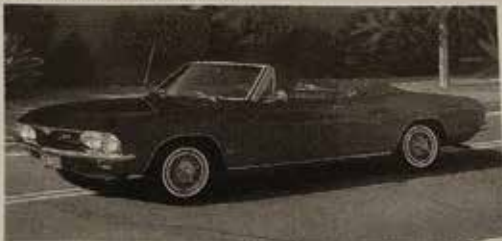
CHEVROLET CORVAIR CORSA 1966